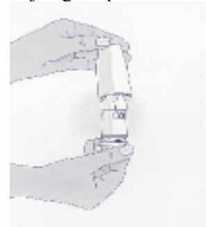
Figuur 1 'Klik'